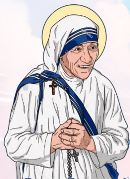
Santa Teresa de Calcuta