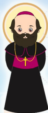
San Daniel Comboni