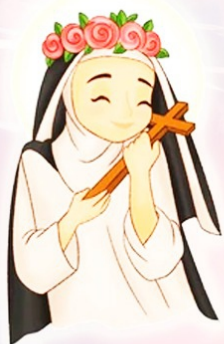
Santa Rosa de Lima