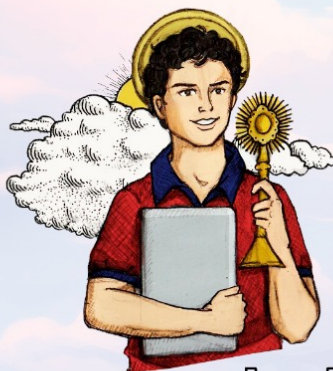
Beato Carlo Acutis