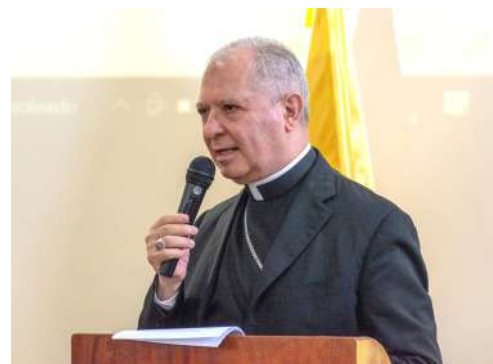
Mons. Paolo Rocco Gualtieri Nuncio Apostólico en el Perú