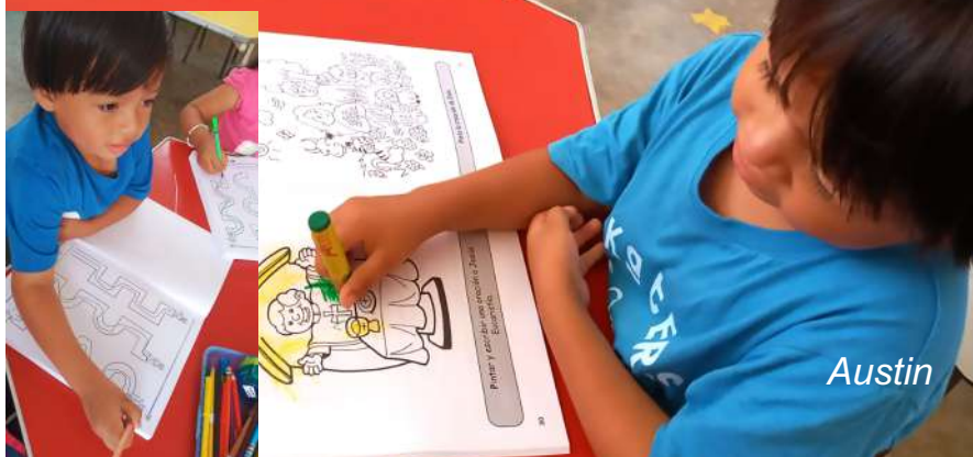
El Abecedario Religioso en las manos de nuestros niños de Educación Inicial.